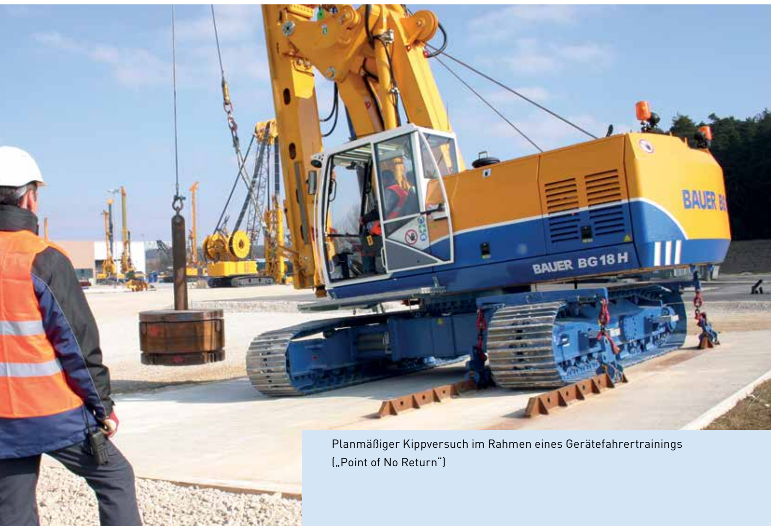
Planmäßiger Kippversuch im Rahmen eines Gerätefahrertrainings („Point of No Return“)