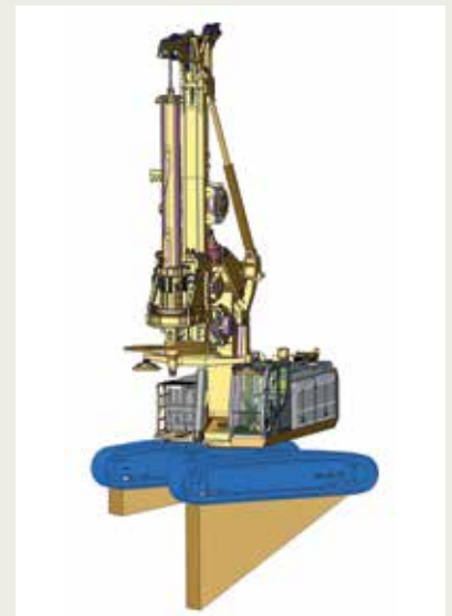
Prinzipdarstellung der Flächenpressung unter den Ketten eines Drehbohrgerätes mit Kelly-Ausrüstung bei unterschiedlichen Laststellungen