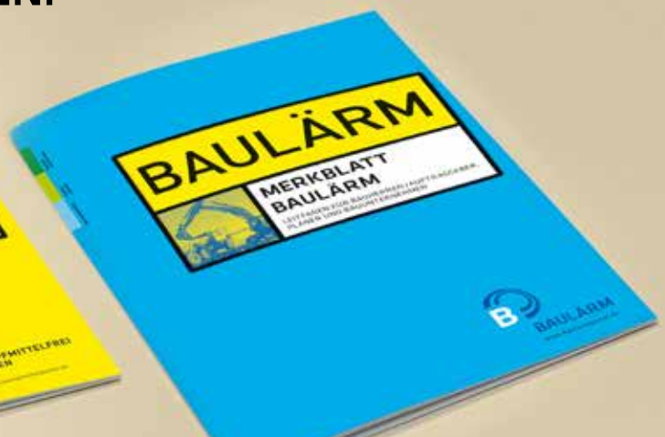
Merkblatt „Baulärm“ www.baulärmportal.de