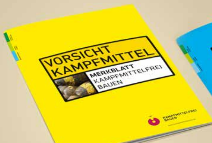
Merkblatt „Kampfmittelfrei Bauen“ www.kampfmittelportal.de